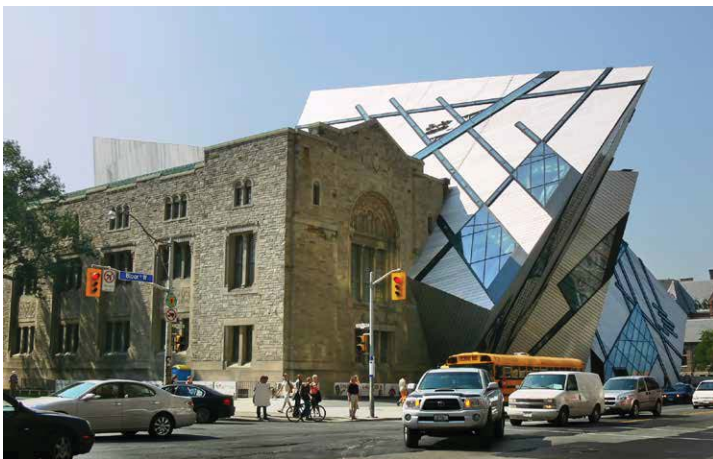
Abb. 13: Der spektakuläre Anbau des Royal Ontario Museum in Toronto, der nach einem Entwurf von Daniel Libeskind entstand.