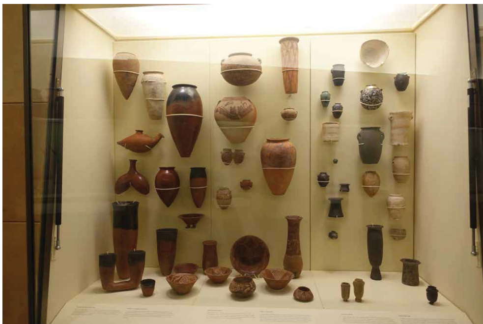
Abb. 16: Vitrine zu Keramik und Steingefässen der vordynastischen Zeit (4000 – 3100 v.Chr.)

Die englischen und französischen Beschriftungen sind kurz und bündig gehalten, enthalten aber die wesentlichen Informationen zu den Exponaten. Mein Besuch fand an einem (verregneten) Wochentag statt. Abgesehen von einigen Schulklassen verirrt sich nur wenige Personen in den Ägyptenteil – vielleicht auch, weil dieser eher versteckt im 3. Stock, weit-ab der bekannten Ausstellungen zu den Ureinwohnern Kanadas und den Dinos liegt, was für geneigte Besucher ein nicht zu unterschätzender Vorteil ist!