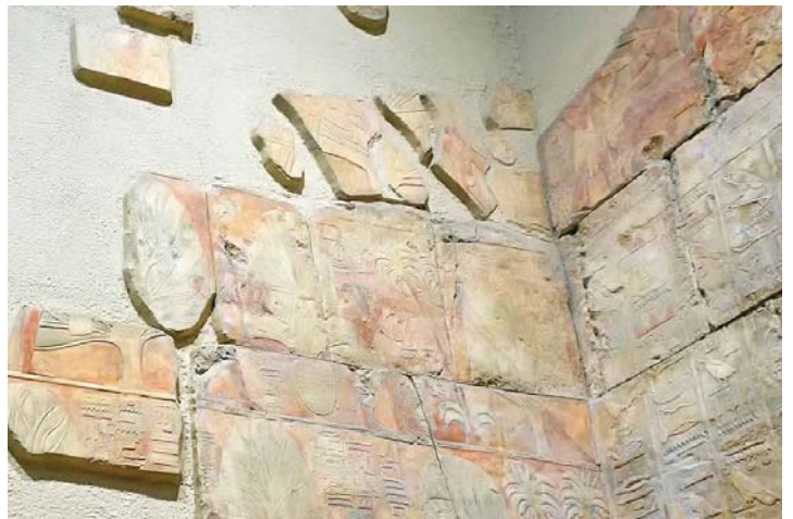
Abb. 22 (rechts): Die Ägypter tragen ausgegrabene Weihrauchbäume zu ihrem Schiff. Weihrauch war im altägyptischen Tempelkult eines der wichtigsten Opfergaben. Der Weihrauchduft galt als Parfum der Götter.