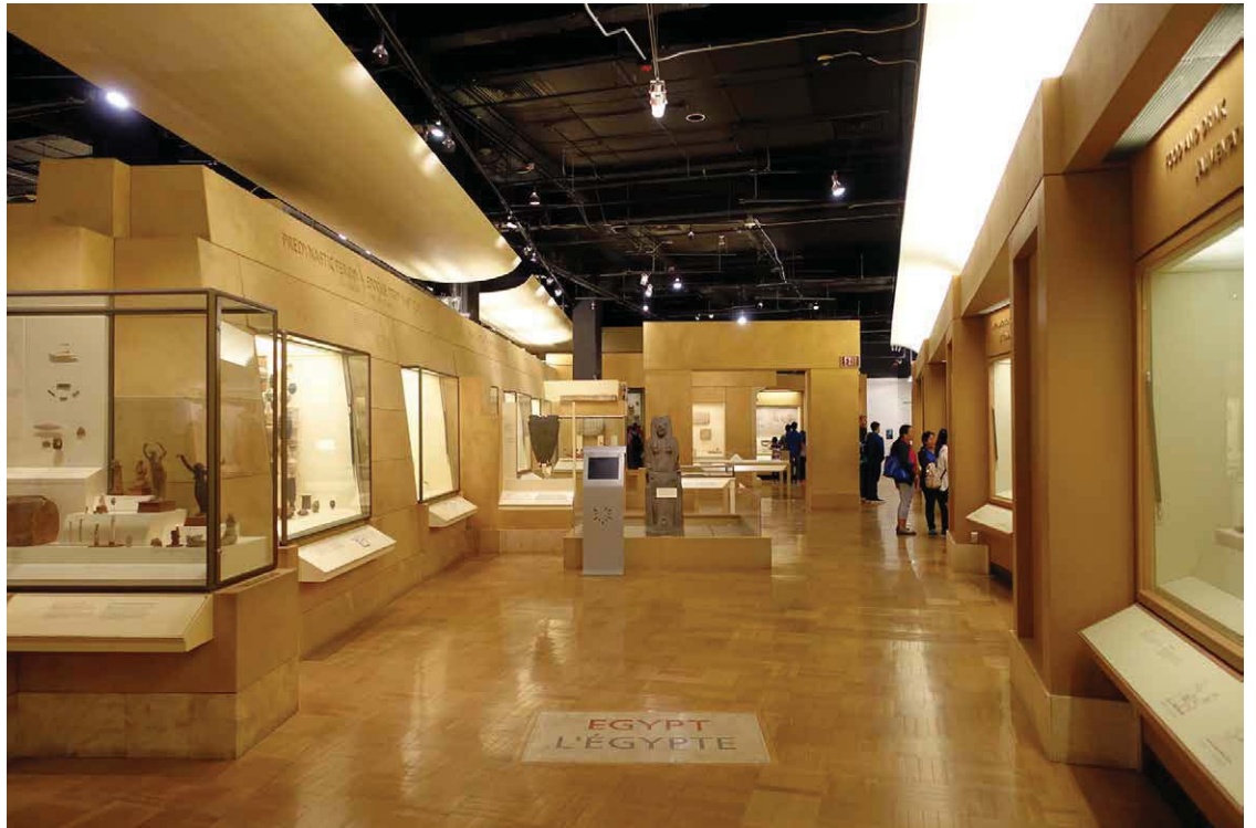
Abb. 15: Eingangsbe- reich zur Dauerausstel- lung Ägypten.

Die Altägyptensammlung des ROM umfasst rund 25'000 Objekte aus der Zeitspanne von 4'000 v.Chr. bis 400 n.Chr.; davon sind knapp 2'000 Exponate in einer Dauerausstellung zu sehen. Auch wenn die letzte Neueinrichtung der Ausstellung schon einige Jahre zurückliegt, präsentiert sich diese in grosszügiger und ansprechender Gestaltung (Abb. 15).