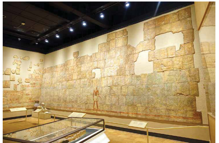
Abb. 21 (oben rechts): Die „Mauer von Punt“ besteht aus Gipsabdrücken der Originalwand im Tempel von Deir el-Bahari.