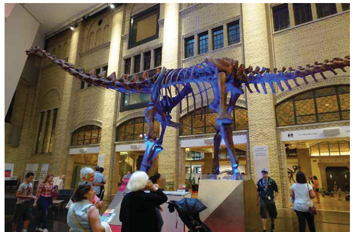
Abb. 14: Eingangshalle des Royal Ontario Museum.