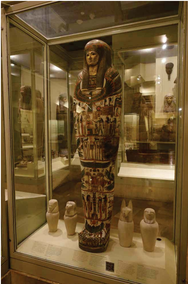
Abb. 17: Das ROM besitzt zahlreiche Särge und Mumien, die in einem hinteren Teil der Ausstellung gezeigt werden.