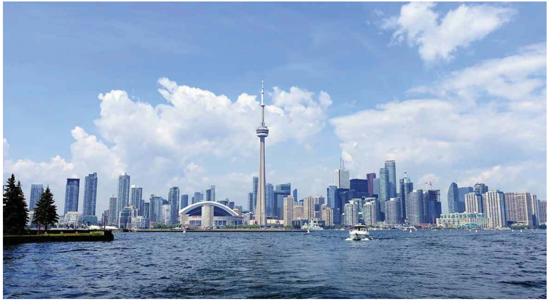
Abb. 12: Die Skyline von Toronto mit dem CN-Tower in der Mitte.

Toronto - idyllisch am nördlichen Ufer des Lake Ontario gelegen, rund zwei Fahrstunden von den berühmten Niagarafällen entfernt - ist mit seinen rund 5 Millionen Einwohnern eine lebendige und sympathisch weltoffene Metropole (Abb. 12). Auch wenn der CN-Tower das eigentliche Wahrzeichen der Stadt ist, so besitzt Toronto mit dem Royal Ontario Museum (ROM) eines der renommiertesten Museen Nordamerikas.