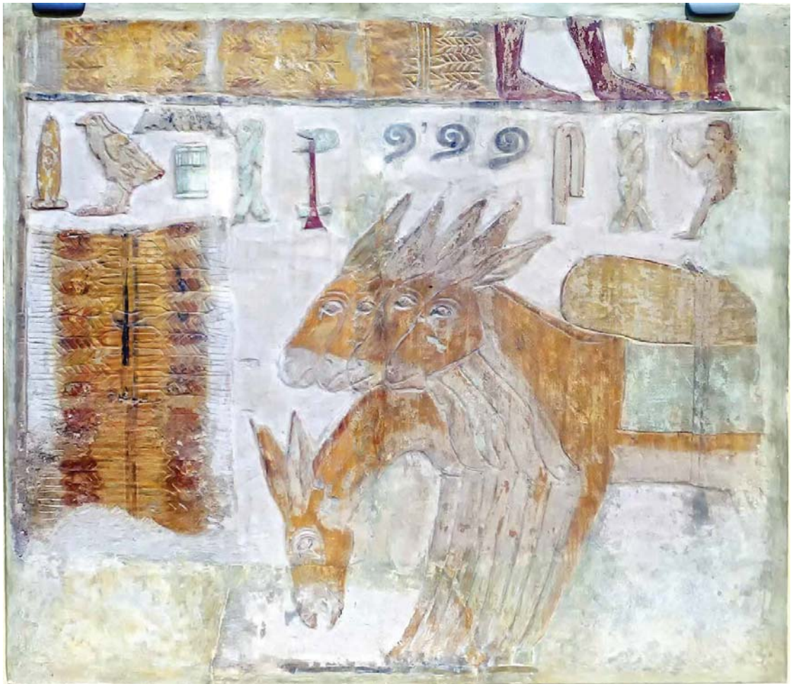
Abb. 19: Das zweite Relief aus dem Grab des Methethi in Toronto zeigt beladene Esel. Dabei handelt es sich um eine Szene aus dem Alltag des Methethi, der als Vorsteher der Domänenarbeiter des Palastes tätig war.