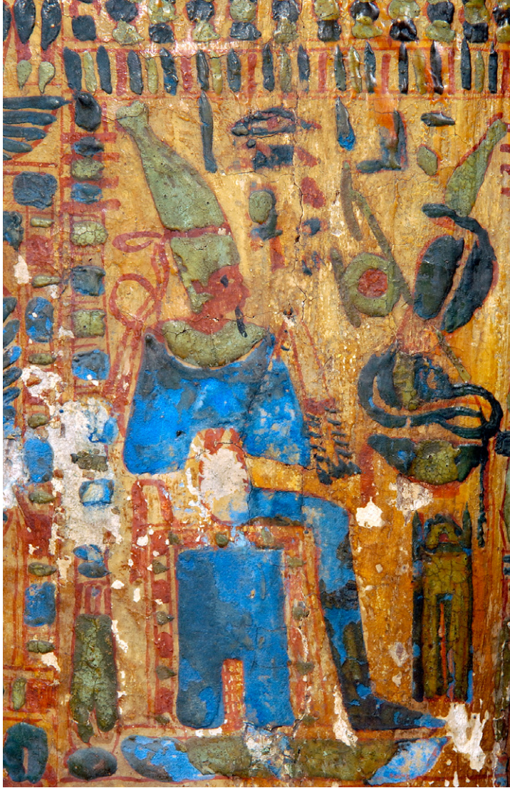
Bei der Figur des sitzenden Osiris hat sich die oberste, mit Firnis durchtränkte Farbschicht des Ägyptischblau gelöst. Darunter wird das ursprünglich leuchtend hellblaue Pigment sichtbar. Detail auf dem inneren Deckel des Sargensembles von Neuchâtel. © Musée d'ethnographie, Neuchâtel. Foto: pmimage.ch.

einer Mischung aus Kalk, Quarzsand und Kupferverbindungen (z.B. Malachit) unter Beigabe von etwas Soda entstand. Ägyptischblau gehört zu den ältesten, künstlich hergestellten Pigmenten der Welt. Nur die schwarzen Pigmente sind nicht mineralischen, sondern pflanzlichen Ursprungs (Kohle). Alle Farben sind mit Wasser angerührt und enthalten ein ebenfalls wasserlösliches Bindemittel tierischen oder pflanzlichen Ursprungs.