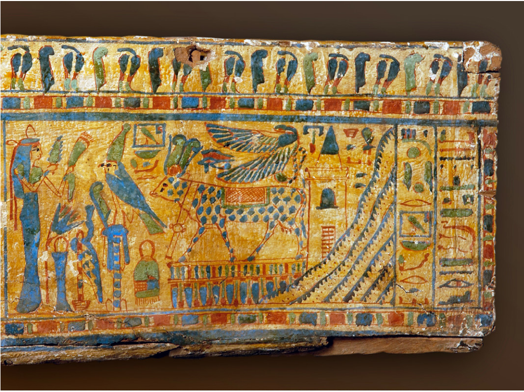
Die Verstorbene (ganz links) ist in ein langes, blaues Kleid gehüllt und mit Haarband und Ohrring geschmückt. Sie opfert der Göttin Hathor, die ihr in Kuhgestalt aus dem Wüstengebirge entgegentritt. Neben ihrem Aspekt als Totengöttin verkörpert Hathor auch mütterlich-schützende Züge und geleitet die Verstorbene sicher ins Jenseits. Szene auf der inneren Wanne des Sargensembles von Neuchâtel.

Oder wurde 1893 anlässlich der Verpackungsarbeiten in Kairo gepatzt, als im Museum die Sendungen für die 17 beschenkten Länder zusammengestellt wurden? So wissen wir z.B. dass das Ensemble im Bernischen Historischen Museum nicht komplett ist, weil ein Teil davon irrtümlicherweise nach Wien gesandt wurde. Eines der Ziele des Schweizer Sargprojektes ist es, die Biographie der untersuchten Särge zu rekonstruieren. Dies kann v.a. für Exponate aus wenig bekannten Perioden wie der 21. Dynastie wertvolle Erkenntnisse liefern. Wie das Neuenburger Sargensemble aber deutlich macht, ist dies oftmals eine schwierige Aufgabe, die nur gelöst werden kann, wenn alle rund um den Globus verstreuten Särge aus dem Grab von Bab el-Gasus publiziert und dadurch für vergleichende Untersuchungen und Analysen zugänglich gemacht werden!